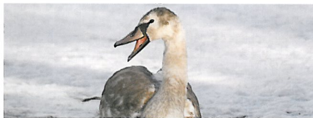
Grafický design: Jana Hradcová. Vydalo NSEV Kladno-Čabárna, 2010