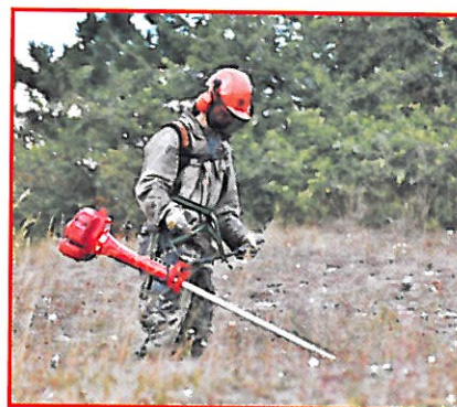
Údržba chráněných území

Vydalo Naučné středisko ekologické výchovy Kladno - Čabárna o.p.s. ve spolupráci s občanským sdružením AVES. Zpracování: Luděk Hora Tisk: Improx spol. s r.o. Náklad: 4000 výtisků (c) NSEV Kladno - Čabárna o.p.s. 2004