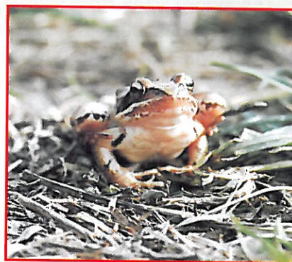
Záchranné transfery obojživelníků