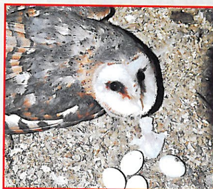
Záchranný program sovy pálené

Od počátku Naučné středisko a občanské sdružení AVES úzce spolupracují na řadě akcí.