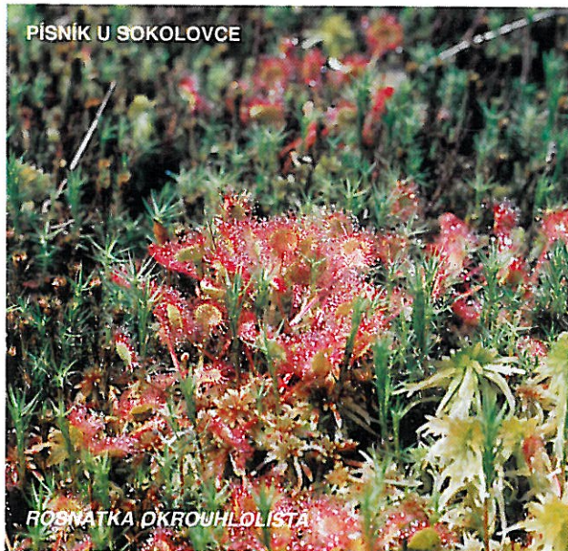
PÍSNÍK U SOKOLOVCE

Předmětem ochrany jsou četné geomorfologické útvary vzniklé v pískovci, který nasedá na křemencové podloží. Na několika místech jsou příbojové zóny druhohorního moře.